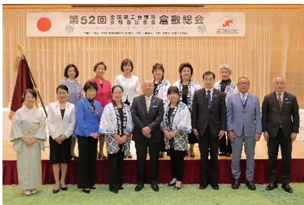
▲初のオンライン開催を終えた大会関係者

プログラムの合間には、ドローンを利用した倉敷空中散歩やオンライン物産展などで参加者に倉敷の