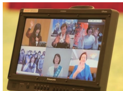
▲倉敷会場から各地へオンライン配信