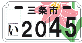
2011.3 (予定) 市の花・ヒメサユリ