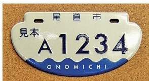
2009.11 瀬戸内海に浮かぶ船型に波