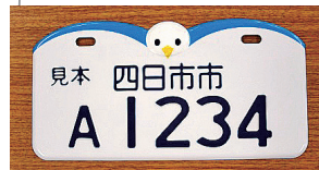
2010.8 市の鳥・ゆりかもめ