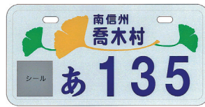
2009.10 村の木・イチヨウ