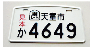
2009.7 将棋の駒型に縁起物の左馬