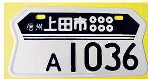
2008.8 上田城の櫓と旗印の六文銭