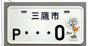
2010.10 三鷹市のキャラクター Poki