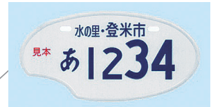
2008.10 ササニシキの産地の米型