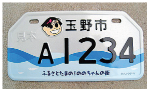
2010.10 ののちゃんど波と魚