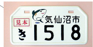
2010.8 水揚げ量日本一のサメ