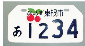
2009.2 生産量日本一のさくらんぼ