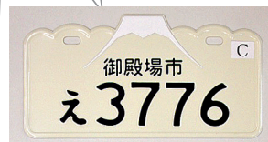
2008.11~2010.4 富士山型 * 御殿場市のほか、富士市、富士宮市、裾野市、小山町、芝川町 (以上、静岡県) 富士吉田市、富士河口湖町、西桂市、忍野村、山中湖村、道志村、鳴沢村 (以上、山梨県)