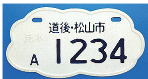
2007.7 小説「坂の上の雲」にちなむ雲型