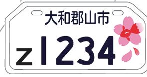
2011.2 金魚と郡山城跡の桜