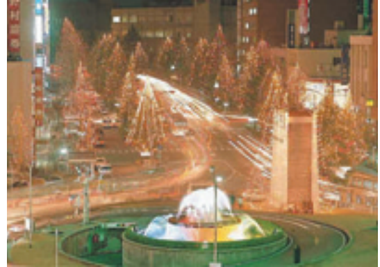
ツリーまつり