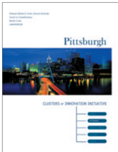
“Clusters of Innovation” 調査報告書表紙

オ関連企業が集積し、「鉄鋼の街」から「ハイテクの街」へと変貌を遂げている。また地元2大学をはじめとする知的インフラの質の高さなどから「全米で最も住みやすい都市」の一つとしても知られるようになった。このようにピッツバーグは地元関係者の積極的な取り組みにより、産業クラスターを新たに創り出すことに成功した事例として注目されている。