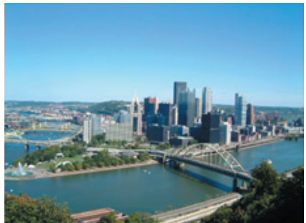
ピッツバーグ（中心部）