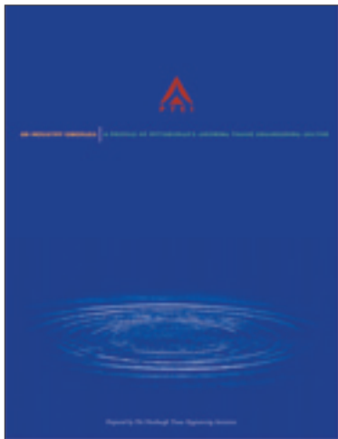
“An Industry Emerges” 表紙

3,000名)、血管造影剤注入システムの開発企業 Medrad 社（売上高：約 3 億ドル、従業員：約1,000 名）などが所在する。90年代後半以降は、地元 2 大学における研究成果をベースとした再生医療分野を中心とするベンチャー企業の設立が相次ぎ、新しい企業群を形成している。