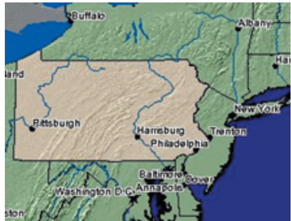
ペンシルバニア州・ピッツバーグ地図