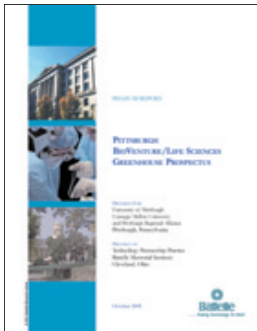
PLSG の業務計画書表紙

PLSG は、タバコ会社からの賠償金を原資とする 州政府からの補助金（5 年間で合計約 3 千万ドルを 予定）と、地元企業等からの資金支援により運営さ れており、約 15 名のスタッフが、①インキュベーター 業務、②地元バイオ企業への助成金支給、③地元大 学への助成金支給、④地元バイオ産業関係者の交流 促進（セミナー、イベント等の企画・開催）などの 業務を行っており、10 年間で 90 社の新会社創出、25 社の企業誘致、5 千人の新規雇用創出等を目標とし ている。