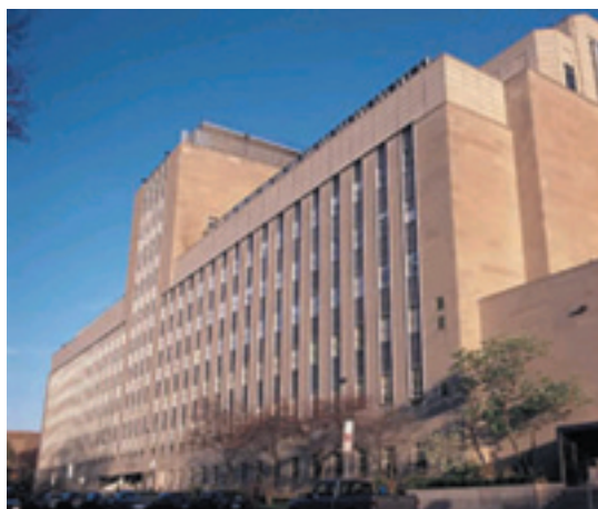
ピッツバーグ大学医学部 (School of Medicine)