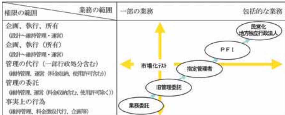
【民間に任せる範囲と手法】

なお、今後適用事例が増加すると考えられるPFI手法と指定管理者制度の併用については、後述することとします。